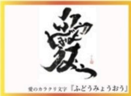
愛のカラクリ文字『ふどうみょうおう』

日本書道院理事 / 文化庁伝統文化推進台長兼講師 「筆海集」全教定賞 他 「第30回国際書道展」最優秀賞受賞 他 ～名筆にして書道指導力～ 1961年 福島県出身。26歳の時、故 平塚春樹氏との出会いを経て、 その才能を見出されて以後、数々の受賞を重ねるとともに、 指導者として後進の育成にも力を注ぐ。 「神の手」とも称されるその書の技巧は、見るもの全てを感動に 包摂して離さない。