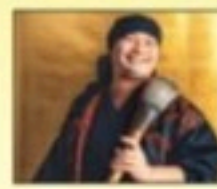
書家・詩人 さかぐち せきどう 坂口 赤道